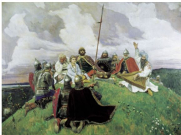
В. Васнецов «Баян»

Музыка — особый вид искусства, способный разговаривать, не произнося слов, рисовать картины без красок и карандашей, она может заставить пережить бушующие страсти без действия и мечтать о прекрасном, погружая в мир фантазии. Ее звуки способны передавать эмоции, создавать ту или иную атмосферу. Достаточно взглянуть на картину В. Васнецова «Баян»,