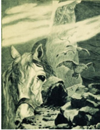
Андрей Рябушкин. Святогор. 1895

Вглядитесь в картину Андрея Рябушкина. Именно таким предстает перед нами Святогор на графическом изображении художника — скучающим, обреченным великаном, живущим высоко на святых горах и не находящим применения своей могучей силе. О нем писатель К. С. Аксаков говорил, что Святогор «вне разряда богатырей, к которому принадлежит Илья Муромец. Это — богатырь-стихия».